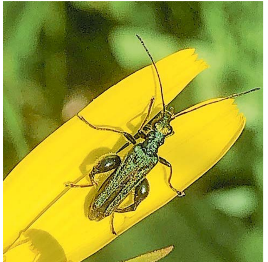
Dieses glänzend grüne Kerlchen entdeckte Werner Zuppinger aus Marthalen. Der sogenannte Grüne Scheinbockkäfer wird etwa 8 bis 12 Millimeter lang.